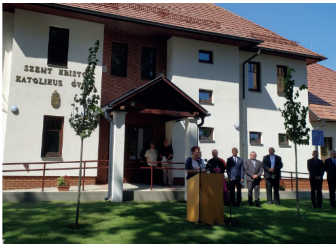
Az új óvoda kilencven gyermek elhelyezésére alkalmas

Főegyházmegyei tanévnyitót tartottak augusztus 30-án a Szentháromság tiszteletére szentelt törökszentmiklósi római katolikus templomban. Az ünnepi összejövetelen a Bercsényi Miklós Katolikus Gimnázium és Kollégium, az idén 10 éves Pánthy Endre Általános Iskola tanárai, diákjai, valamint a Szent Kristóf Óvoda pedagógusai és kicsinyei vehettek részt a járványügyi előírásoknak megfelelő módon és létszámban. A járvány miatt az Egri Főegyházmegye köznevelési intézményeinek pedagógusai és lelkipásztorai a Szent István Rádió és Televízió YouTube csatornáján keresztül követhették az ünnepi eseményt.