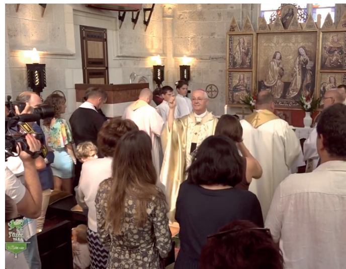
Ismét liturgikus hely lett a várkáporna

A szentmisét követően a történelmi egyházak jelen lévő képviselői is áldást mondtak a megújult kápolnában.