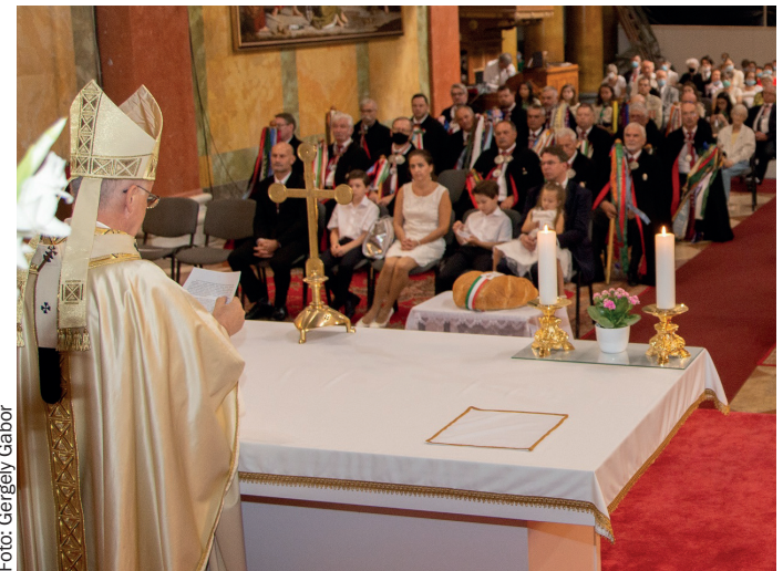
Szent István azt üzeni nekünk: nincs másik alap, csak Krisztus