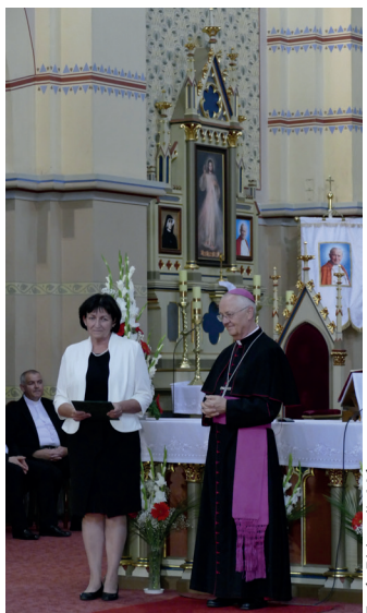
A főpásztor Szent Gellért-díjakat adott át a tanévnyitón

Főegyházmegyei tanévnyitót tartottak augusztus 30-án a Szentháromság tiszteletére szentelt törökszentmiklósi római katolikus templomban. Az ünnepi összejövetelen a Bercsényi Miklós Katolikus Gimnázium és Kollégium, az idén 10 éves Pánthy Endre Általános Iskola tanárai, diákjai, valamint a Szent Kristóf Óvoda pedagógusai és kicsinyei vehettek részt a járványügyi előírásoknak megfelelő módon és létszámban. A járvány miatt az Egri Főegyházmegye köznevelési intézményeinek pedagógusai és lelkipásztorai a Szent István Rádió és Televízió YouTube csatornáján keresztül követhették az ünnepi eseményt.