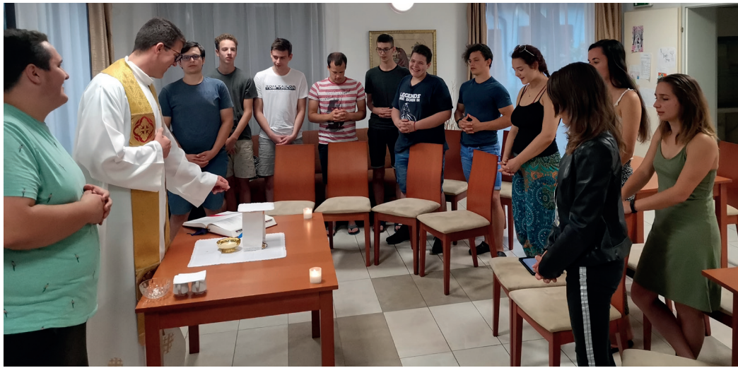
Tábori körülmények között, minden este együtt ünnepelhettük a szentmisét

Nagy öröm volt számunkra, hogy együtt lehettünk, hiszen az elmúlt hónapokban a vírus-helyzet miatt sajnós szüneteltettük a péntek esti ifjúsági hittanokat és az ifjúsági zenekar próbáit. Az együtt töltött idő jó hangulatban telt. Az időjárás kegyes volt hozzánk, hiszen a programokat, melyeket elterveztünk meg tudtuk valósítani. Szinte minden nap sikerült a Tisza-tó egyik-másik strandjára elbicikliznünk. Ebbe a pár napba bele-