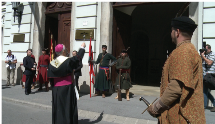
Ternyák Csaba érsek megáldotta az épületre felkerült egyetemi táblát

– A hit meghatározó diadala a mai nap – fogalmazta meg beszédében, melyben beszámolt az egyetemmel válás folyamatáról. Az ünnepségen jelen lévő Balog Zoltán, az emberi erőforrások minisztere arról szólt, hogy az Eszterházy Károly Főiskola mindig is nyitott volt a fejlődésre, számos területen állt élen a tanulmányi és a kutatómunkában. Az intézmény már eddig is bizonyított.