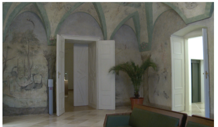
A Madaras terem falát a ritka madarakról készített színes rajzok díszítik