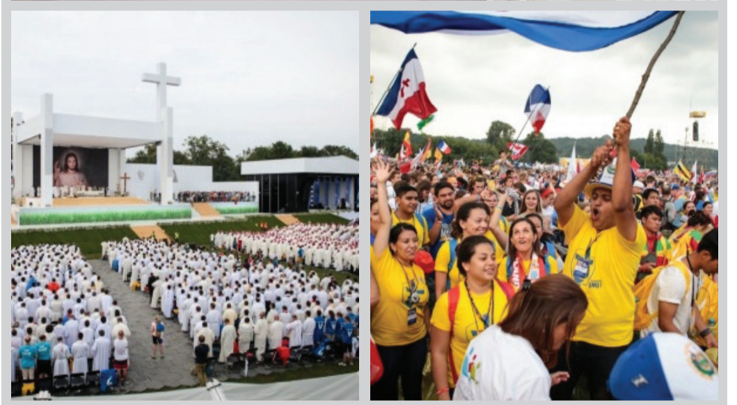
A világtalálkozón jelen volt Ferenc pápa is, aki csütörtökön csatlakozott a zarándokokhoz

natra irányította a találkozót a zarándokainak figyelmét.