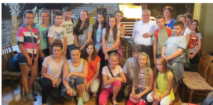
A diákok megtekintették a bazilika orgonáját

Krakkóban talákoztak a katolikus fiatalok