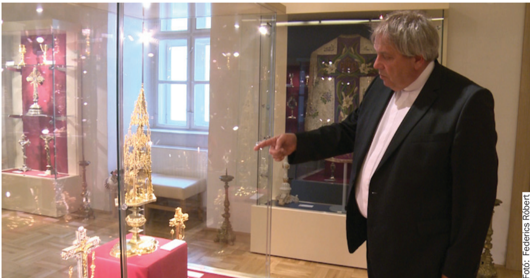
Bemutatásra kerülnek 15–16. századi ötvös remekek