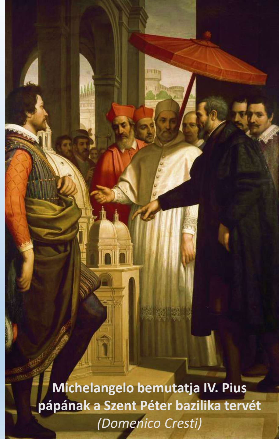
Michelangelo bemutatja IV. Pius pápának a Szent Péter bazilika tervét (Domenico Cresti)