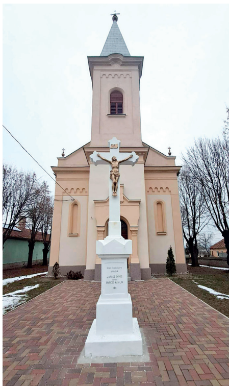
A vilmányi templom homlokzata és ablakai is megújultak

December 10-én, szombaton a kápolnai Szeplőtelen Fogantatás-templomban búcsú szentmisét