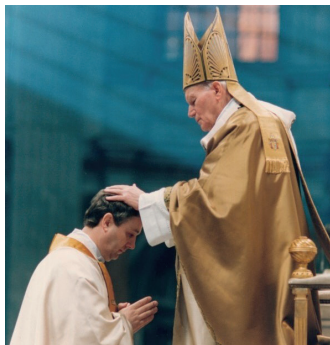
Ternyák Csabát püspökké szenteli II. János Pál pápa

2010-től 2015-ig a Magyar Katolikus Püspöki Konferencia elnökhelyettese, 2015-2020 között az MKPK Állandó Tanácsának tagja volt. Munkásságának köszönhetően jelentős számú katolikus oktatási-nevelési intézmény kezdte meg működését az Egri Főegyházmegyében. 2012-ben megalapította a Redemptoris Mater Egyházmegye