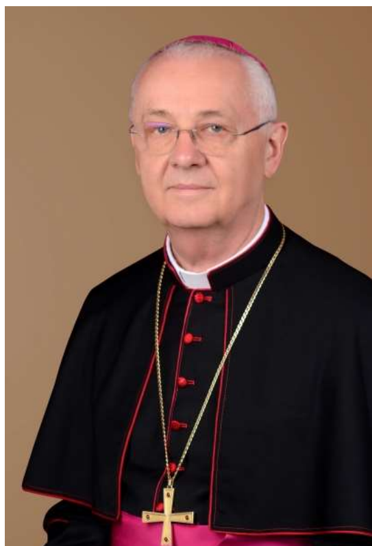
Ternyák Csaba egri érsek