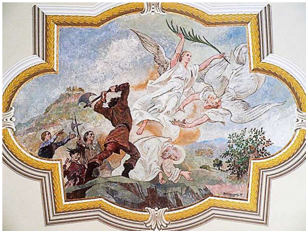
Csepellényi vértanúhalála (Füzér, Szent István Római Katolikus Templom)