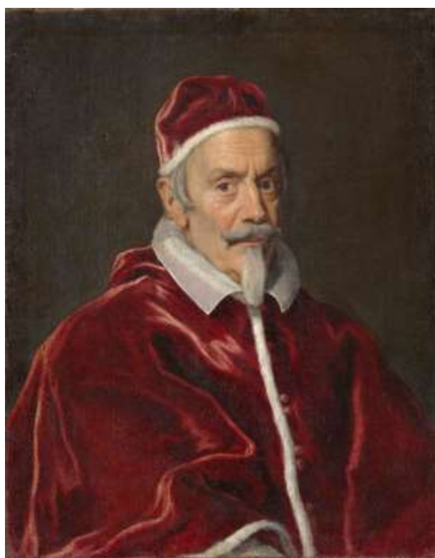
X. Kelemen pápa