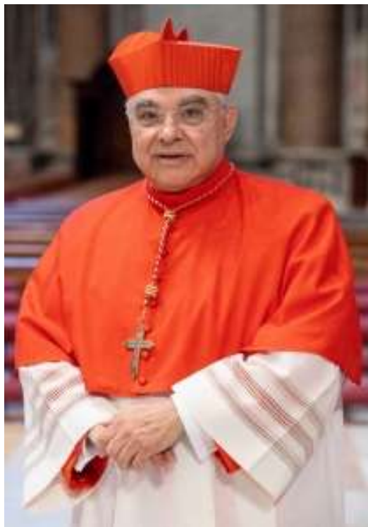
Marcello Semeraro bíboros