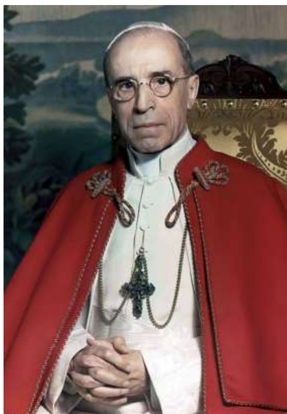
XII. Piusz pápa