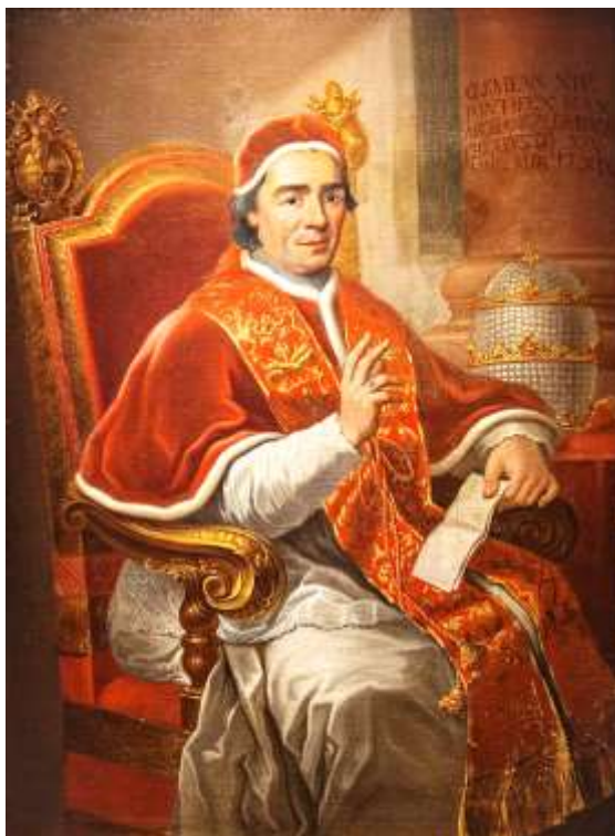
XIV. Kelemen pápa