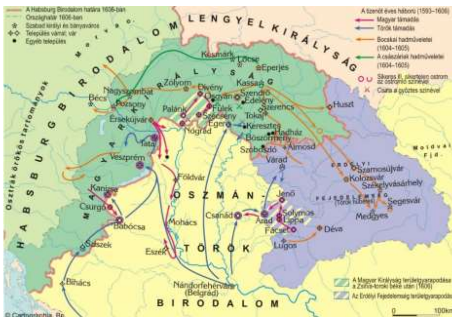
A 15 éves háború és a Bocskai felkelés.