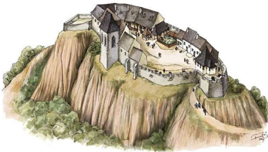
Füzér vára - rekonstrukciós elképzelés - Ferenc Tamás grafikája