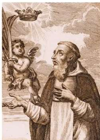
V.P. Georgius Csepellényi O.S.Pauli primi Eremita Martyr.

XIV. Kelemen pápa előtt ismét beszélt, az eljárás azonban először 1786-ban, másodszor pedig 1950-ben akadt el.