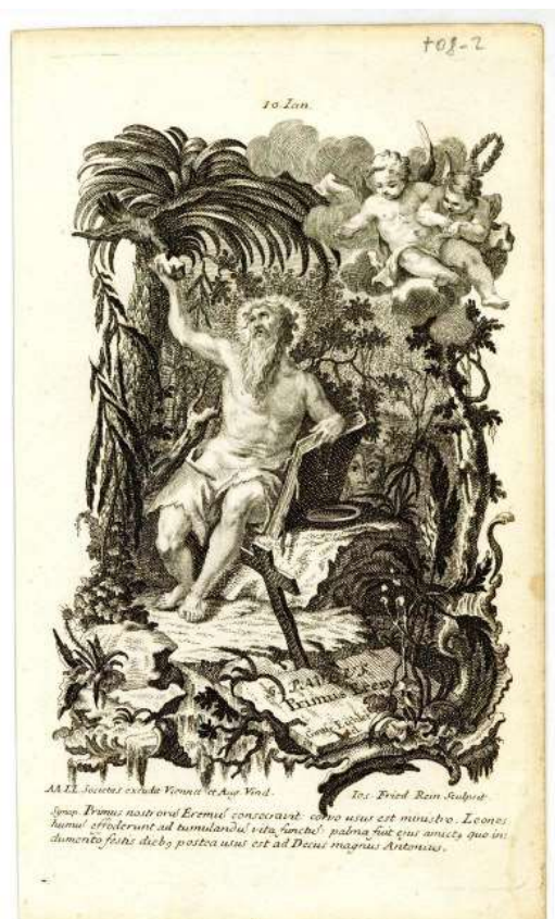
Remete Szent Pál